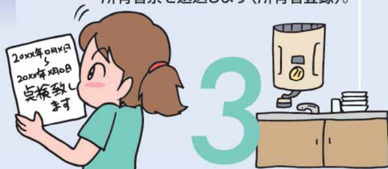
点検時期が来たら通知が届きます。

※分譲マンションにおいても、上記の対象製品を購入される場合はこの制度が適用されます。