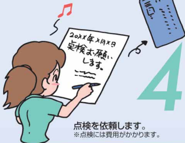
点検を依頼します。