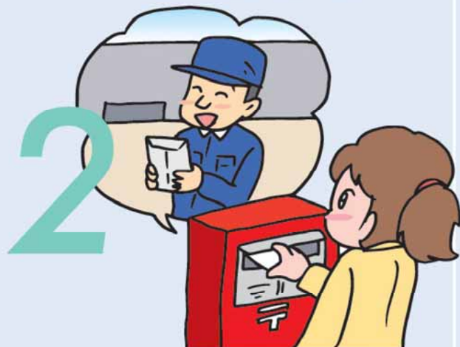
所有者票を返送します(所有者登録)。