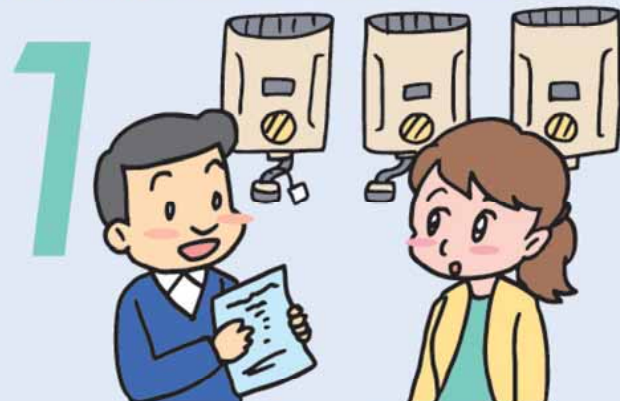
販売者から点検制度についての説明を受けます。